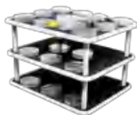
PP-20/3 BS-010126-DK платформа

Плоская платформа с нескользящим резиновым покрытием позволяет размещать различные контейнеры с низким профилем.