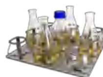
P-9/500 BS-010135-AK платформа