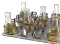
P-16/250 BS-010135-CK платформа