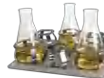
P-6/1000 BS-010135-DK платформа