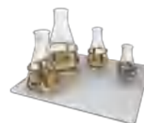
UP-168 BS-010135-JK платформа

Плоская платформа с нескользящим резиновым покрытием позволяет размещать различные контейнеры с низким профилем.