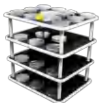
PP-20/4 BS-010126-EK платформа

Плоская платформа с нескользящим резиновым покрытием позволяет размещать различные контейнеры с низким профилем.