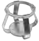
FC-250 BS-010126-JK зажим

Зажимы для колб объёмом 250 мл - Ø85 мм для UP-168