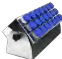
TR-21/50 BS-010135-KK штатив

Штатив с регулируемым углом наклона для UP-168