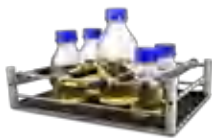
UP-330 BS-010145-AK платформа

Универсальная платформа с регулируемыми фиксирующими стержнями позволяет разместить лабораторную посуду различной геометрии.