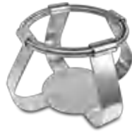
FC-1000 BS-010126-IK зажим

Зажимы для колб объёмом 500 мл - Ø105 мм для UP-168