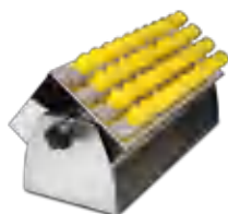
TR-44/15 BS-010135-LK штатив

Двухсторонний клейкой коврик. SPML совместим с платформой UP-168, которая устанавливается как на орбитальный шейкер PSU-20i, так и на шейкеры-инкубаторы.