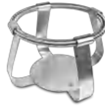
FC-2000 BS-010126-NK зажим

Зажимы для колб объёмом 1000 мл - Ø130 мм для UP-168