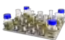
P-30/100 BS-010135-BK платформа

Универсальная платформа с регулируемыми фиксирующими стержнями позволяет разместить лабораторную посуду различной геометрии.