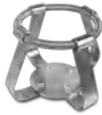
FC-500 BS-010126-LK зажим

Зажимы для колб объёмом 250 мл - Ø85 мм для UP-168