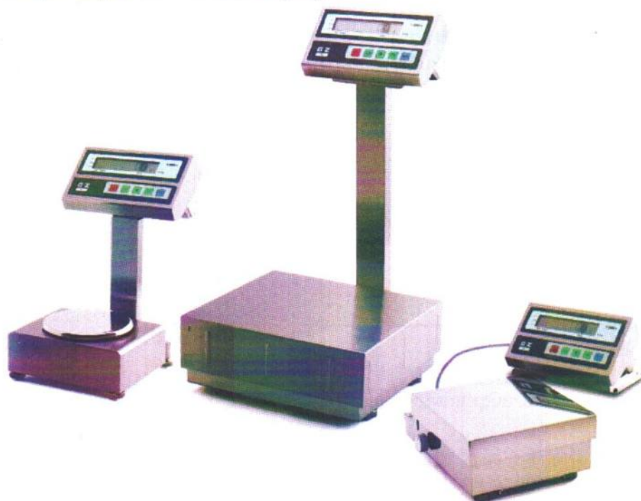
Рисунок 1 – Общий вид весов неавтоматического действия GZII, GZH.

Весы снабжены следующими устройствами и функциями (в скобках указаны соответствующие пункты ГОСТ OIML R 76-1–2011):