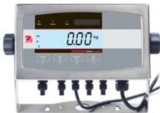
Весовой терминал T51XW