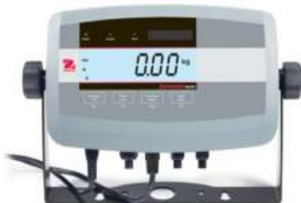
Весовой терминал T51P