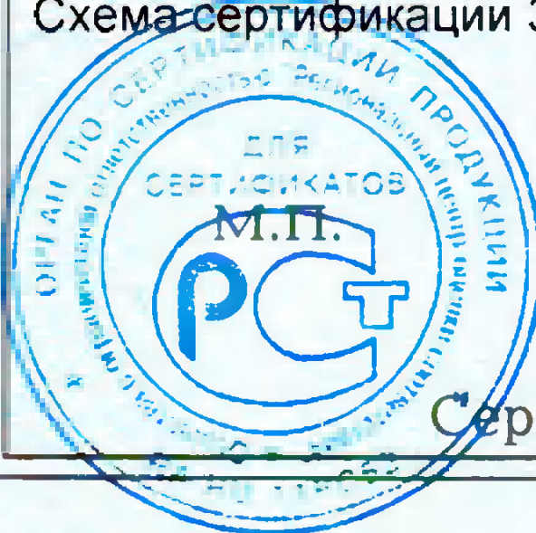
Схема сертификации 3, инспекционный контроль 1 раз в год.

Место нанесения знака соответствия – в товаросопроводительной документации, графическое изображение знака соответствия по ГОСТ Р 50460-92 с надписью «Добровольная сертификация».