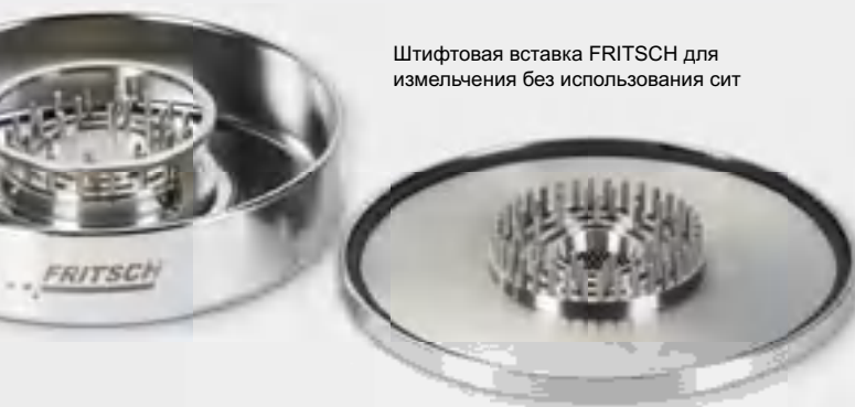
Штифтовая вставка FRITSCH для измельчения без использования сит

А это есть только у FRITSCH: Для измельчения без использования сит самых сложных, среднетвердых, содержащих масло или жир материалов, таких как воск или парафин, оснастите PULVERISETTE 14 уникальным штифтовым ротором и подходящей крышкой камеры измельчения с штифтовой вставкой для измельчения без применения кольцевого сита.