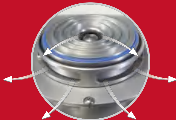
Система подачи воздуха для эффективного охлаждения пробы

А это есть только у FRITSCH: Система направления потоков воздуха PULVERISETTE 14 обеспечивает постоянство потока воздуха для охлаждения ротора, всех компонентов двигателя, а также измельчаемого материала в приемном сосуде. Одновременно более мощный вентилятор, который подает в мельницу охлаждающий воздух через поролоновый фильтр частиц создает избыточное давление и предотвращает, таким образом, проникновение загрязняющих частиц из окружающего воздуха.