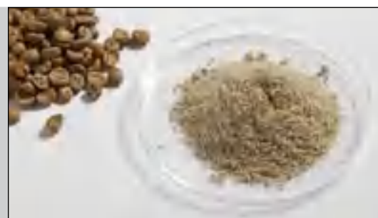
Сырой кофе перед измельчением и после измельчения в P-14 с кольцевым ситом с 1 мм трапециевидной перфорацией при 20000 об/мин