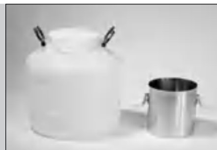
Большой приемный сосуд 30 л, малый приемный сосуд 5 л