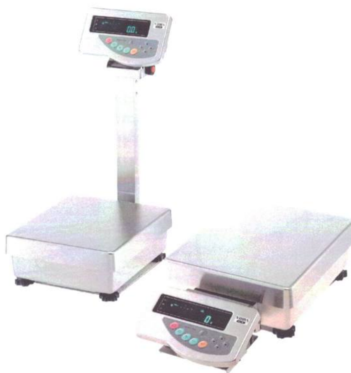
Рисунок 1 - Общий вид весов неавтоматического действия Н1

Принцип действия весов основан на преобразовании частоты вибрации акустического весоизмерительного датчика, возникающей при его растяжении или сжатии под действием взвешиваемого груза, в цифровой электрический сигнал, изменяющийся пропорционально массе взвешиваемого груза. Результаты взвешивания выводятся на дисплей.