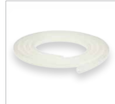
1 Артикул 000.0361.0