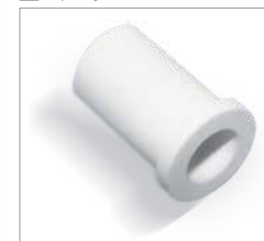
9 Артикул 340.0054.0