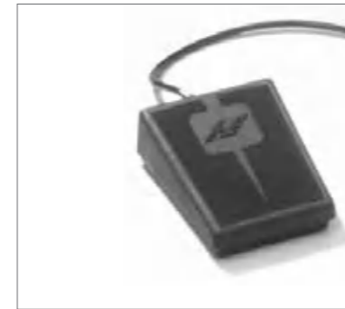
1 Артикул 443.0755.0