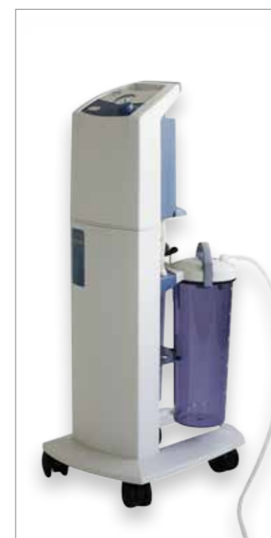
2 Артикул 340.0333.0