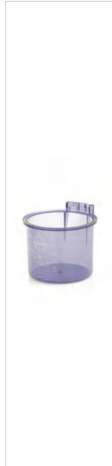
1 Артикул 340.0050.0