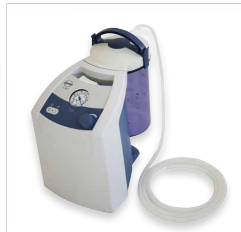
4 Артикул 340.0338.0