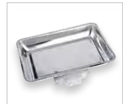
9 Артикул 443.0790.0