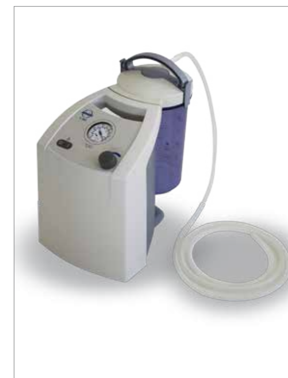
2 Артикул 340.0350.0