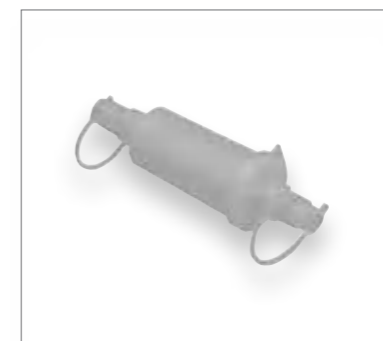
5 Артикул 401.0555.0