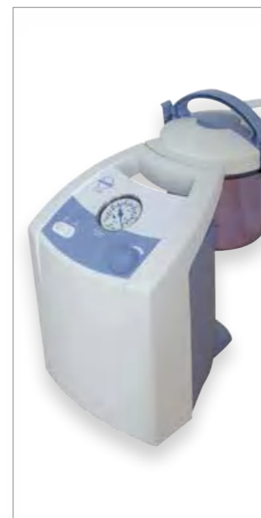
3 Артикул 340.0339.0