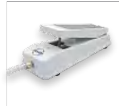
2 Артикул 443.0310.1