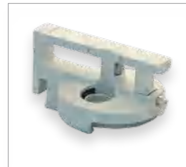
7 Артикул 444.0650.0