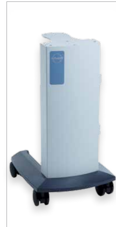
8 Артикул 340.0070.0