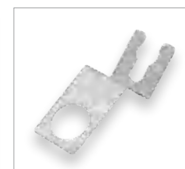
8 Артикул 340.0066.0