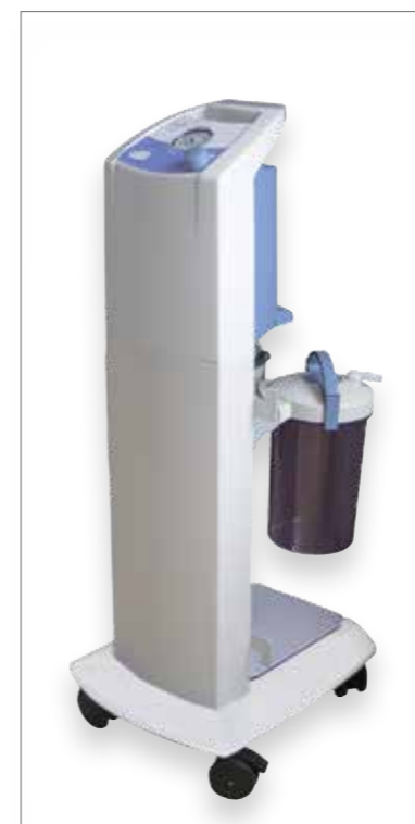
1 Артикул 340.0334.0