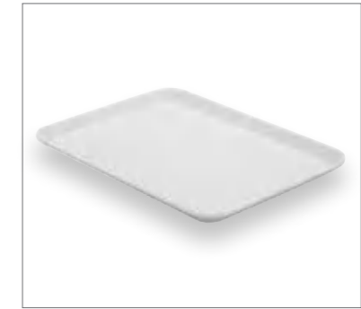
6 Артикул 340.0084.0