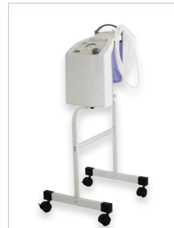
3 Артикул 340.0361.0