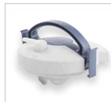
1 Артикул 340.0040.0