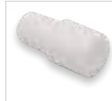
4 Артикул 340.0062.0