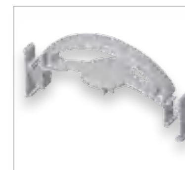
3 Артикул 340.0055.0