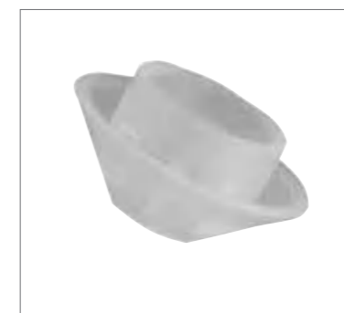
5 Артикул 340.0056.0