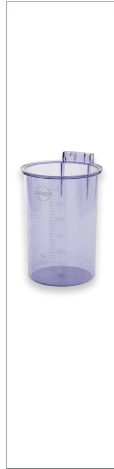
2 Артикул 340.0051.0