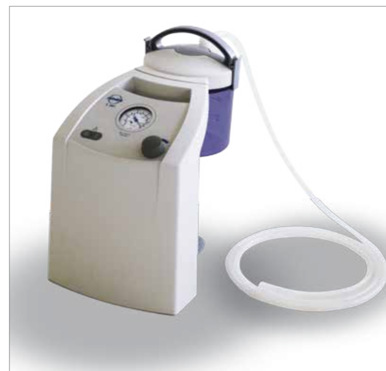
1 Артикул 340.0351.0