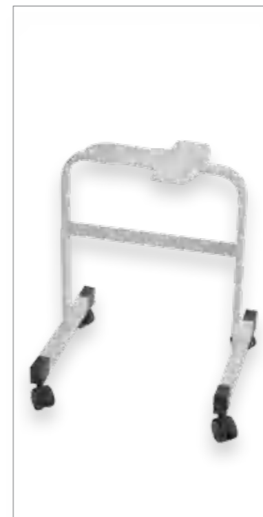
7 Артикул 320.0070.1