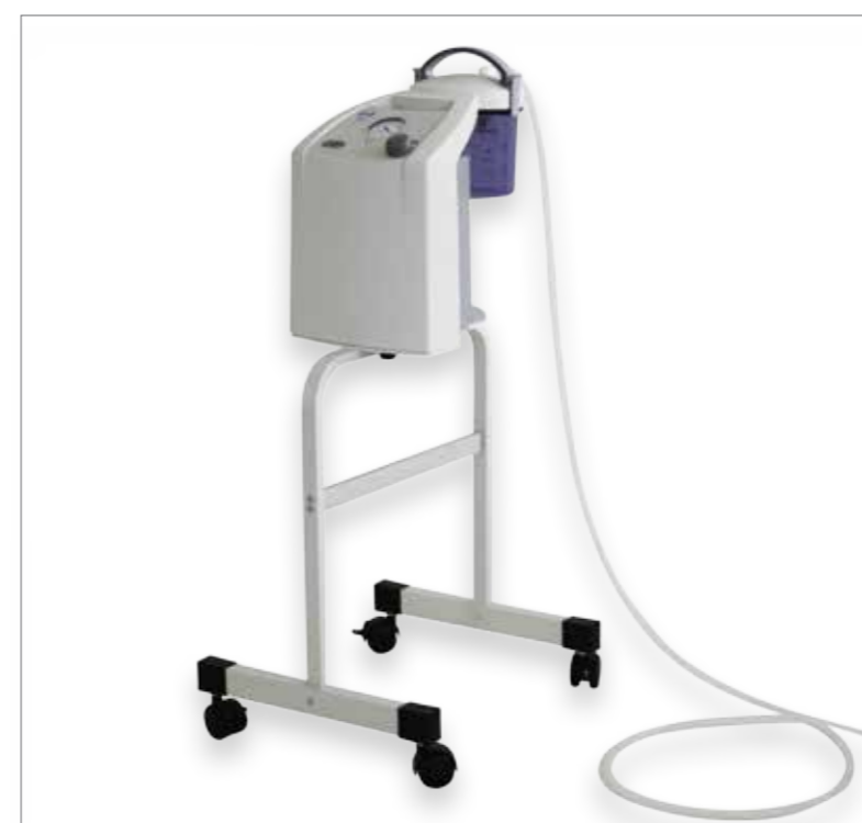
4 Артикул 340.0360.0