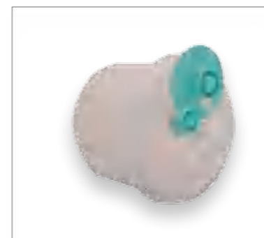
4 Артикул 340.0061.0