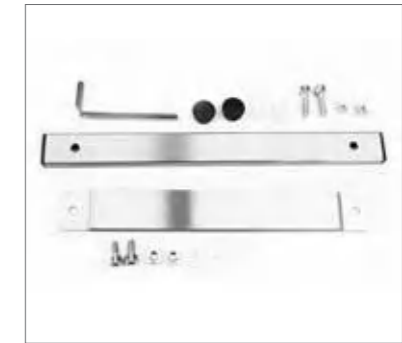
3 Артикул 340.0081.0