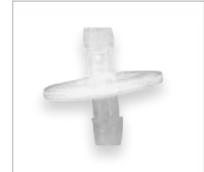
3 Артикул 443.0738.0