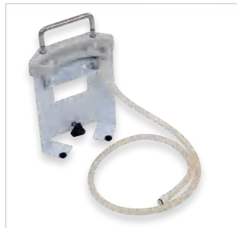
7 Артикул 320.0640.0