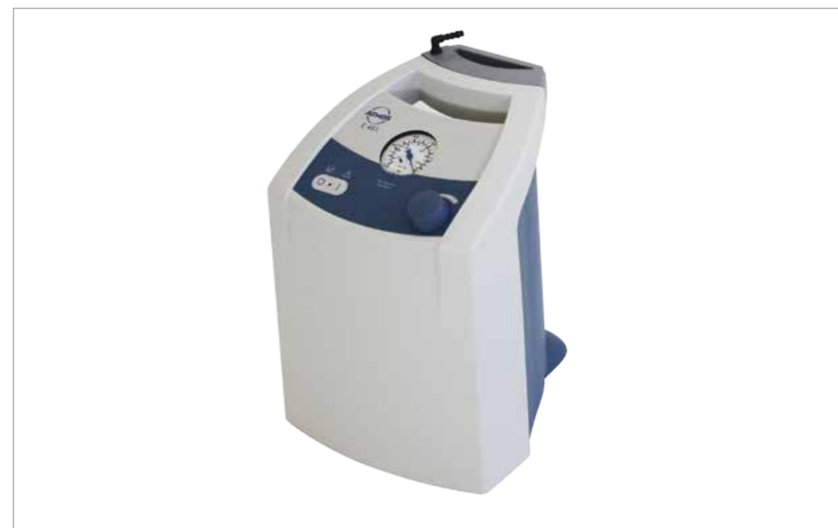
2 Артикул 340.0357.0