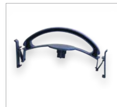
4 Артикул 340.0326.0