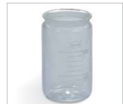
6 Артикул 444.0032.0