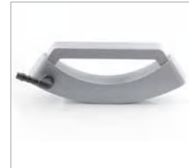
5 Артикул 340.0059.0