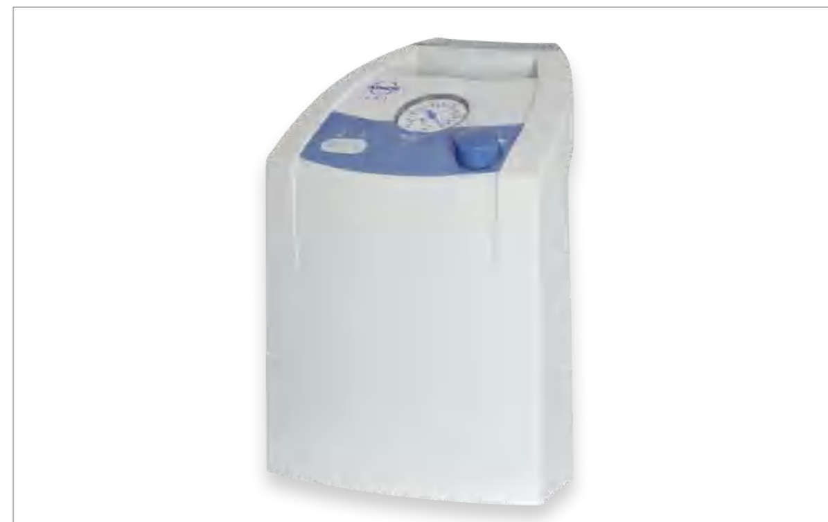
1 Артикул 340.0300.0