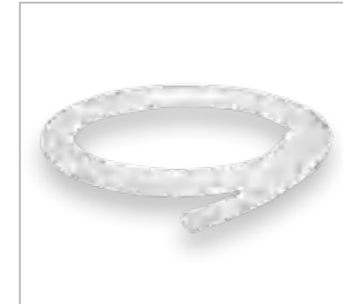
2 Артикул 000.0243.0