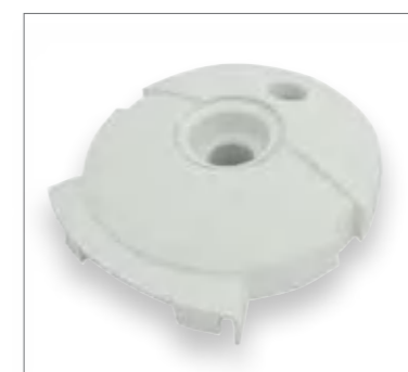
2 Артикул 340.0053.0