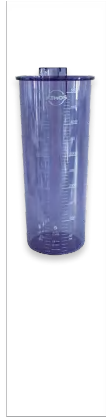
3 Артикул 340.0052.0