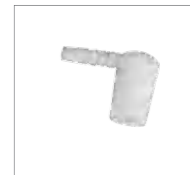
6 Артикул 340.0057.0