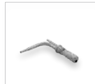
8 Артикул 444.0640.0