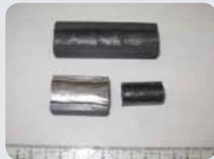
Благодаря размерам 30 мм кварцевой трубки можно анализировать все промышленные сварные образцы.

G4 PHOENIX может анализировать диффундирующий водород в образцах различных материалов. Аналитическая система состоит из быстронагреваемой инфракрасной печи с кварцевой трубкой. Диаметр трубки 30 мм, что позволяет без проблем анализировать образцы большого размера. Простая и надежная калибровка измерительной системы осуществляется благодаря газовому калибровочному устройству, рассчитанному на 10 различных объемов газа. Основа системы – чрезвычайно стабильный высокочувствительный детектор теплопроводности, определяющий сверхнизкие содержания водорода.