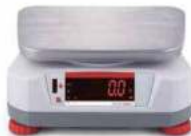
Тыльный дисплей со встроенным бесконтактным датчиком.

Используя два ярких светодиодных дисплея (передний и задний), одновременно несколько операторов могут выполнять однотипные операции взвешивания на одних и тех же весах. Даже в не самых благоприятных условиях большие яркие дисплеи позволяют без труда считывать результаты взвешивания с большого расстояния. Благодаря двум дисплеям весы также удобно использовать в розничной торговле. Наличие больших дисплеев спереди и сзади позволяет использовать весы Valor 4000 в розничной торговле, где покупатель должен видеть вес взвешиваемого товара.