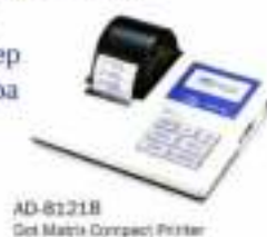
AD-8121B Dot Matrix Compact Printer