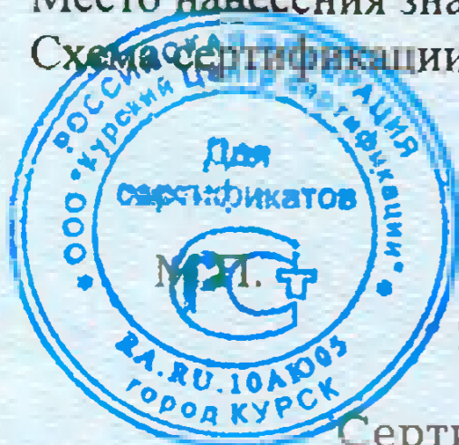
Схема сертификации: Зс.

Место нанесения знака соответствия: на сопроводительной технической документации.