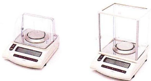
Рисунок 1 – Общий вид весов неавтоматического действия СТ.

Принцип действия весов основан на преобразовании частоты вибрации акустического весоизмерительного датчика, возникающей при его деформации под действием взвешиваемого груза, в цифровой электрический сигнал, изменяющийся пропорционально массе взвешиваемого груза. Результаты взвешивания выводятся на дисплей.