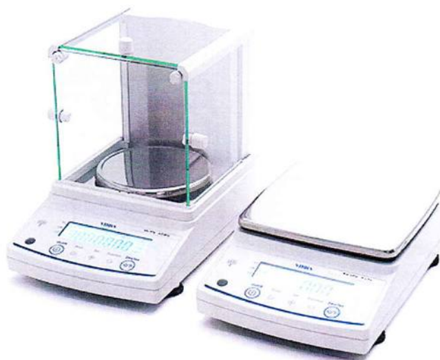
Рисунок 1 – Общий вид весов неавтоматического действия АВ

Принцип действия весов основан на преобразовании частоты вибрации акустического весоизмерительного датчика, возникающей при его деформации под действием взвешиваемого груза, в цифровой электрический сигнал, изменяющийся пропорционально массе взвешиваемого груза. Результаты взвешивания выводятся на дисплей.