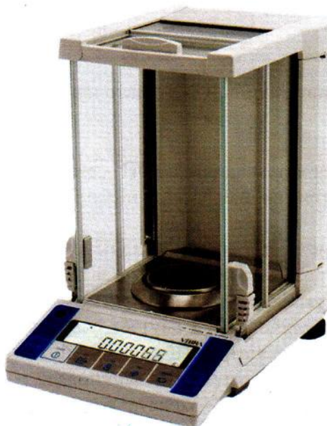
Рисунок 1 - Общий вид весов неавтоматического действия АФ.

Принцип действия весов основан на компенсации массы взвешиваемого груза электромагнитной силой, создаваемой системой автоматического уравнивания. Электрический сигнал, изменяющийся пропорционально массе взвешиваемого груза, преобразуется в цифровой код. Результаты взвешивания выводятся на дисплей.