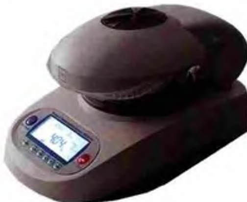
Рисунок 1 — Общий вид анализаторов

Общий вид анализаторов показан на рисунке 1.