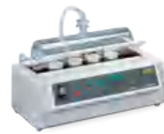
Wet Digester B-440 Озоление