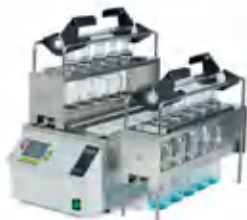
SpeedDigester K-439 / K-425 / K-436 ИК-минерализация