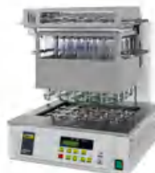
KjelDigester K-446 / K-449 Блочная минерализация