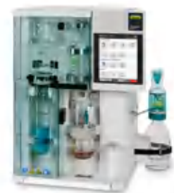
KjelMaster K-375 Паровая дистилляция и титрование