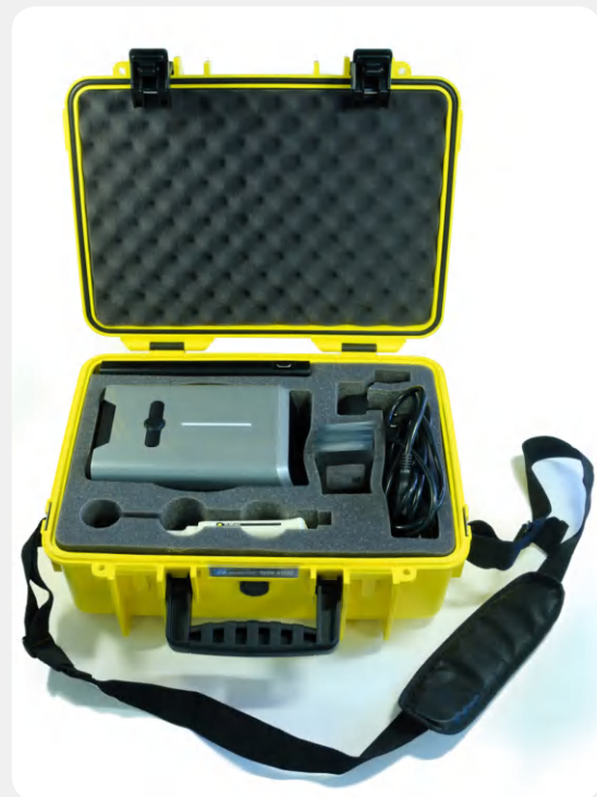
Кейс с прибором