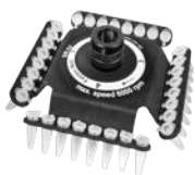
SR-32 BS-010205-FK ротор