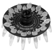
R-0.5/0.2 BS-010205-BK ротор

Ротор для 12 x 0.5 мл и 12 x 0.2 мл пробирок