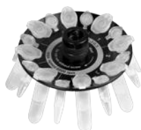
R-2/0.5 BS-010205-CK ротор

Ротор для 8 x 2/1.5 мл и 8 x 0.5 мл пробирок