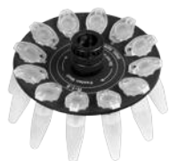
R-1.5 BS-010205-AK ротор

Ротор для 12 x 0.5 мл и 12 x 0.2 мл пробирок