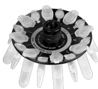
R-2/0.5 BS-010205-CK ротор

Ротор для 8 x 2/1.5 мл и 8 x 0.5 мл пробирок