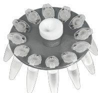
R-1.5M BS-010201-AK ротор

Ротор для 12 × 0.5 мл и 12 × 0.2 мл пробирок