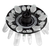
R-2/0.5/0.2 BS-010205-DK ротор

Ротор для 8 x 2/1.5 мл и 8 x 0.5 мл пробирок