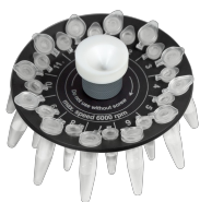
R-0.5/0.2M BS-010201-BK ротор

Ротор для 12 × 0.5 мл и 12 × 0.2 мл пробирок