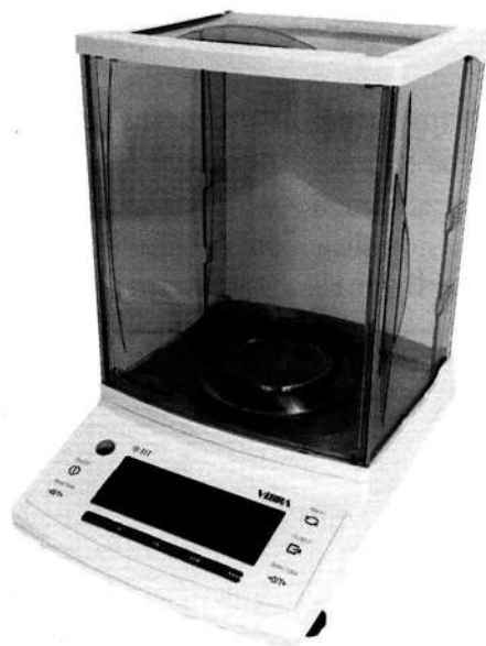
Рисунок 1 – Общий вид весов неавтоматического действия НТ

Принцип действия весов основан на преобразовании изменения частоты вибрации акустического весоизмерительного датчика, возникающего при его деформации под действием силы тяжести объекта измерений, в цифровой электрический сигнал, изменяющийся пропорционально массе объекта измерений.