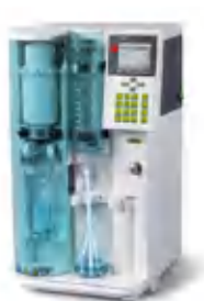
KjelFlex K-360 Паровая дистилляция