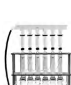
Reflux Setup С водяным или воздушным обратным холодильником