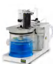
Scrubber K-415 Нейтрализация