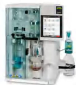
KjelMaster K-375 Паровая дистилляция и титрование