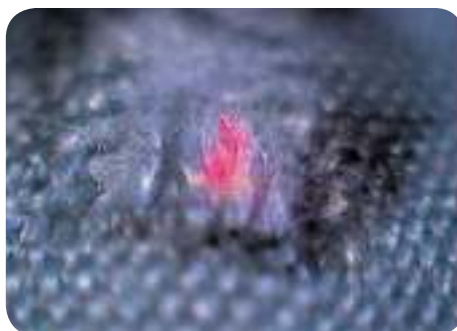
Ткань со следами выстрела

Двумерное картирование области 2x2,5мм (20 x 25 измерений с шагом 100 мкм, 5 сек. на точку) проведено спектрометром с Mo трубкой и поликапиллярной оптикой. Анализировались частицы размером до 10 мкм. Распределение частиц на ткани позволяет точно установить угол, с которого произведен выстрел.