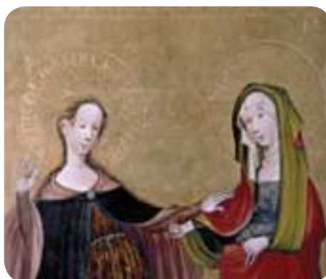
Гёттингенский алтарь францисканской церкви (1424)

Слои золота и серебра толщиной около 1 мкм исследовались с использованием W-трубки и коллиматора 0,65 мм. W мишень трубки гарантирует высокую чувствительность для следов серебра. В результате анализа удалось определить слои из чистого серебра, 23½ карата розового золота, а также исторические сорта золота, такие как зеленое золото (30% Cu) и сусальное золото (слой золота, сплавленный со слоем серебра).