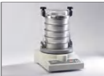
Мельница и Виброгрохот в одном приборе