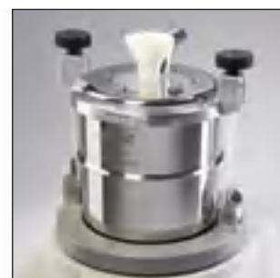
Сосуд FRITSCH Kryo-Box для быстрого, простого охрупчивания

Мельница FRITSCH PULVERISETTE 0 это идеальная лабораторная мельница для тонкого измельчения среднетвердых, хрупких, влажных или чувствительных к температуре проб – в сухой среде или в суспензии – а также для гомогенизации эмульсий и паст.