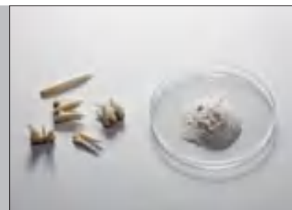
Зубы до и после измельчения с помощью FRITSCH PULVERISETTE 0