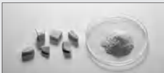
Костный материал до и после измельчения с помощью FRITSCH PULVERISETTE 0

Для измельчения костей, например, для спектрометрического анализа при разработке медикаментов, мы рекомендуем вибрационную микромельницу PULVERISETTE 0 со ступкой и мелющими шарами из двуокиси циркония или стали. Особенное преимущество: щадящая подготовка без образования тепла и термического воздействия.