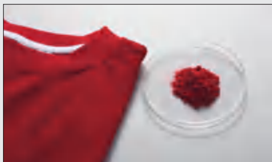
Брикетированные элементы из KBr для исследования проб волокон

Для исследования волокон при помощи инфракрасной спектроскопии мельница PULVERISETTE 23 обеспечивает идеальную подготовку пробы для создания гомогенных брикетированных элементов из бромида калия (KBr). При добавлении 20 мг KBr она за 3 минуты измельчает пробу в гомогенный порошок. При добавлении еще 250 мг KBr, который в течение 90 секунд также был измельчен в PULVERISETTE 23, измельченная проба в течение 30 секунд продолжает измельчаться и гомогенизироваться.