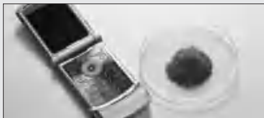
Клавиатура сотового телефона: результат измельчения после охрупчивания в условиях заморозки

Для измельчения отдельных электронных компонентов, например, сотовых телефонов для анализа по RoHS, вибрационная микромельница FRITSCH PULVERISETTE 0 – в зависимости от свойств пробы при комнатной температуре или при криогенном измельчении после охрупчивания жидким азотом в практичном сосуде FRITSCH Kryo-Vox – показывает очень хорошие результаты.