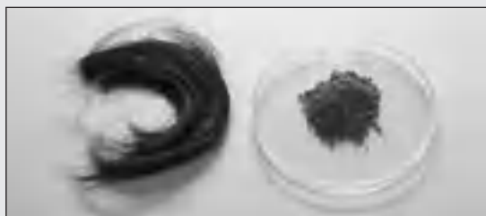
Проба волос – до и после измельчения с помощью PULVERISETTE 23

Для быстрой и простой подготовки проб волос для исследования на наличие наркотиков в мини-мельнице FRITSCH PULVERISETTE 23 примерно 300-500 мг волос при помощи стального шара 15 мм в стальном стакане 15 мл за 5 минут можно измельчить в тончайший порошок (< 100 мкм).