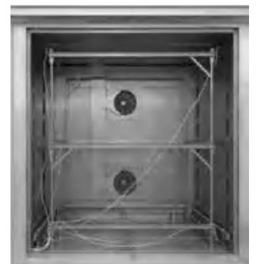
Съемная мерная стойка для конвекционной камерной печи N 7920/45 HAS