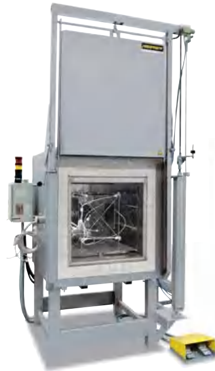
Измерительная рама для определения однородности температуры

В стандартной печи однородность температуры +/- К гарантируется без замера печи. Но в качестве дополнительного оборудования можно заказать модуль измерения однородности температуры при установке определенной температуры в полезном пространстве согласно DIN 17052-1. В зависимости от модели печи в ней размещается рама, которая соответствует размерам полезного пространства. На этой раме в 11 заданных точках измерения крепятся термоэлементы. Измерение распределения температуры осуществляется при температуре, заданной клиентом, по истечении предварительного установленного времени выдержки. При необходимости также можно откалибровать разные заданные температуры или определенный рабочий диапазон.