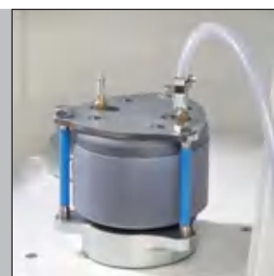
PULVERISETTE 4 при измельчении в среде защитного газа