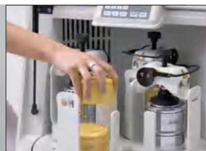
Особенно экономит время: одновременное измельчение до 8 проб