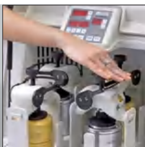
Быстро и надежно: практичная система Safe-Lock