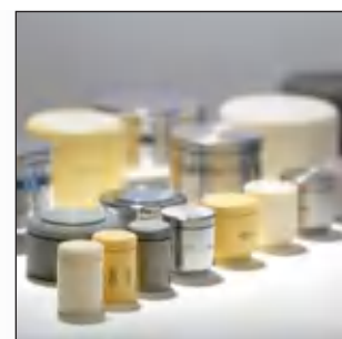
Особенно многосторонняя: программа размольных стаканов фирмы FRITSCH