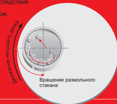
Принцип действия планетарных шаровых мельниц

Конкретные примеры применения и таблицу с результатами измельчения Вы найдете на сайте www.fritsch.com.ru