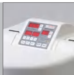
Практично: пленочная клавиатура с возможностью управления при закрытой мельнице