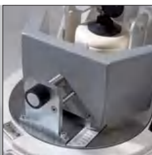
Балансировка за счет простой компенсационной механики

Общая потребляемая мощность 100-120/200-240 В/1~, 50-60 Гц, 1100 ватт Мощность вала двигателя по VDE 0530, EN 60034 0,75 кВт Вес нетто 63 кг брутто 83 кг Габариты Ш x Г x В настольная модель: 37 x 53 x 50 см Упаковка Ш x Г x В деревянный ящик: 68 x 54 x 72 см Значение звуковой эмиссии на рабочем месте прим. до 85 дБ(А) (в зависимости от измельчаемого материала, используемых размольных стаканов/шаров, выбранного числа оборотов) № для заказа 06.2000.00