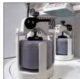
Также возможно: p-5 classic line с 2 местами для размольных стаканов