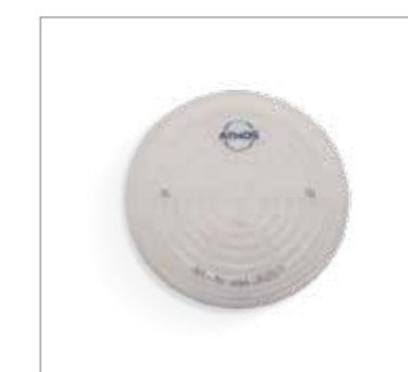
7 Артикул 444.0628.0