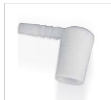
10 Артикул 340.0057.0