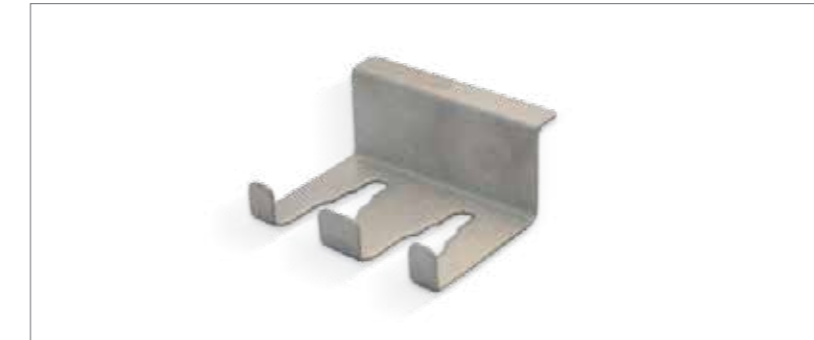
3 Артикул 320.0611.0