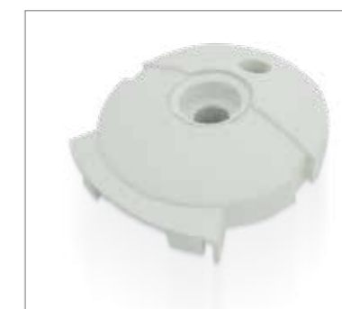
6 Артикул 340.0053.0