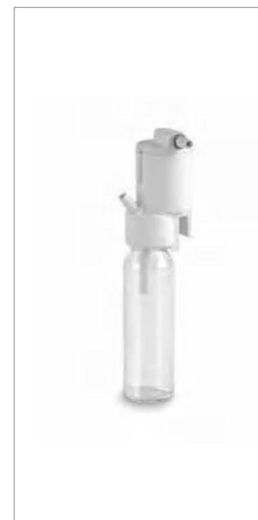
8 Артикул 444.0646.1