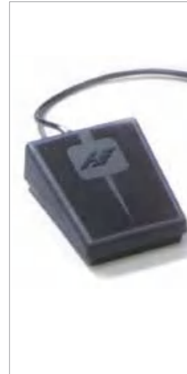
1 Артикул 443.0755.0