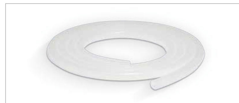
2 Артикул 000.0361.0