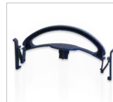
8 Артикул 340.0326.0