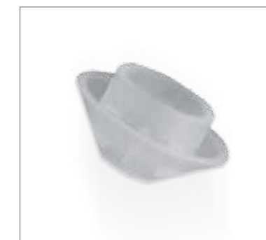
9 Артикул 340.0056.0