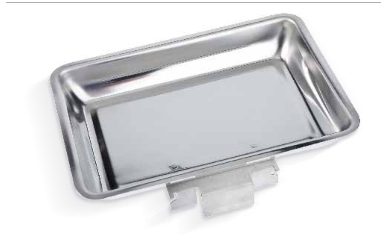
4 Артикул 443.0790.0