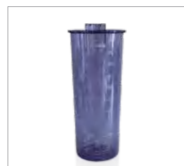
4 Артикул 340.0052.0