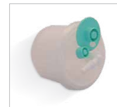
4 Артикул 340.0061.0