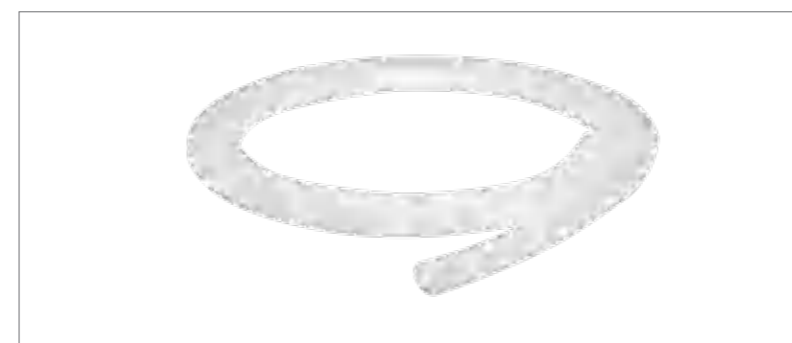
1 Артикул 000.0243.0