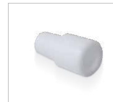
12 Артикул 340.0062.0