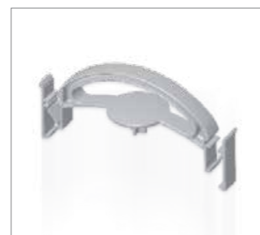
7 Артикул 340.0055.0