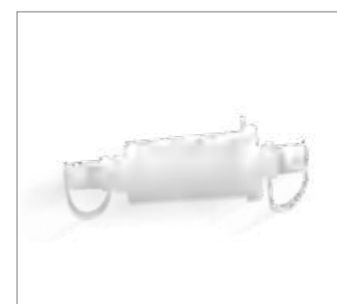
5 Артикул 401.0555.0