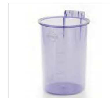
3 Артикул 340.0051.0