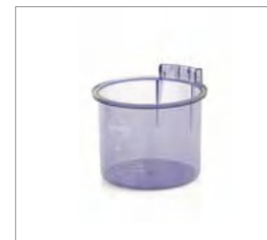
2 Артикул 340.0050.0