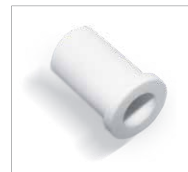
3 Артикул 340.0054.0