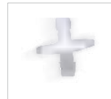
6 Артикул 443.0738.0