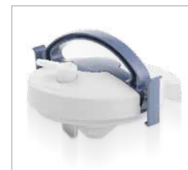
5 Артикул 340.0040.0