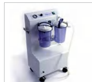
1 Артикул 444.0930.0