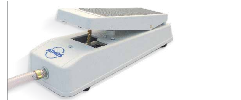
2 Артикул 443.0770.0