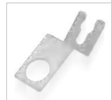
11 Артикул 340.0066.0