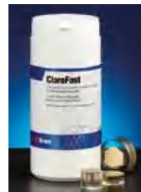
ClaroFast –прозрачная смола, которая позволяет исследовать поверхность образца после запрессовки