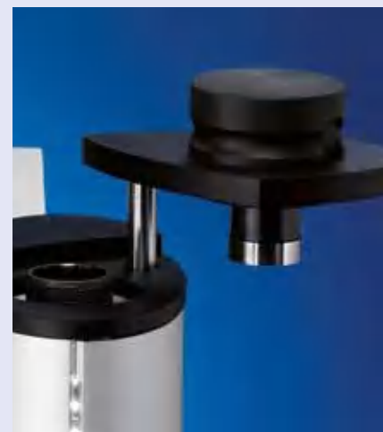
Подъемник верхней крышки