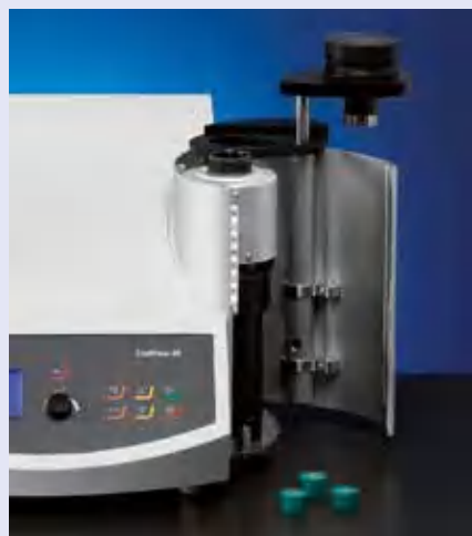
Легкий доступ к блоку запрессовки