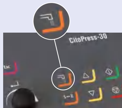
Ассоциативная операционная панель управления