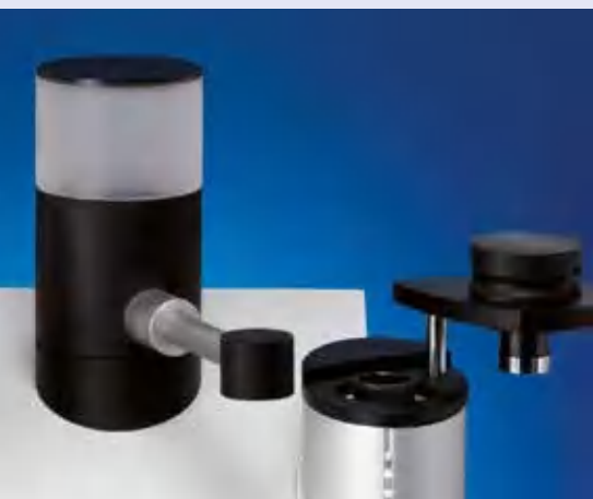
Автоматическая система дозирования смол