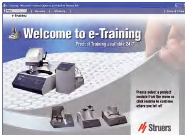
Электронные детали залитые в EpoFix и EpoDye

Для CitoVac имеется возможность доступа к электронной обучающей программе E-Training компании Struers. Когда Вам необходима надлежащая практическая помощь, Вы можете найти необходимую информацию на сайте электронного обучения компании Struers. Просматривайте видео с наглядной демонстрацией распаковки, установки и управления CitoVac. Освежите свои знания или ознакомьте новых сотрудников с CitoVac в любое удобное время. Пожалуйста, свяжитесь с Вашим местным представителем для получения более подробной информации.