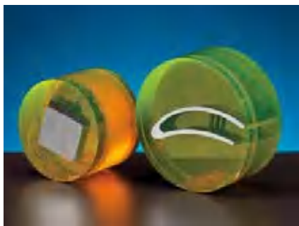
Стальные детали, запрессованные в EpoFix и EpoDye

Чем меньше образец, тем короче время откачивания, обеспечивающее удаление всего воздуха из пустот и трещин. В зависимости от числа и размера образцов, время создания вакуума варьируется от нескольких минут до 20 минут и больше.