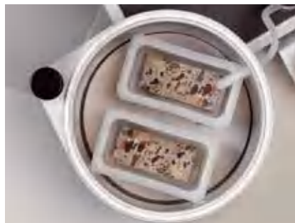
Большая вакуумная камера для крупных образцов