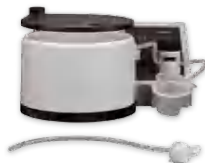
CitoVac с одноразовой трубкой для оптимальной безопасности и сохранения времени

Во время приклеивания образца для тонких срезов, образец прижимается к предметному стеклу, используя прижимной стержень, который проходит через шарикоподшипник в крышке. Таким образом, получается эффективное приклеивание даже более тонким слоем клея без пузырьков воздуха.