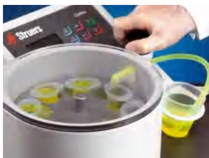
Быстрая и легкая заливка с держателем заливочных формочек Struers

С CitoVac могут быть залиты одновременно несколько образцов. В держатель с отверстиями диаметром 30 мм могут быть установлены до 10 образцов, с отверстиями диаметром 40 мм – до 8 образцов одновременно. Кроме того, большая рабочая камера также позволяет заливать большие образцы в вакууме. Таким образом, в CitoVac может заливаться образец с диаметром до 200 мм