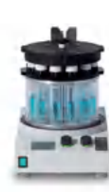
Multivapor™ P-6 / P-12 Эффективное управление нескольких образцов