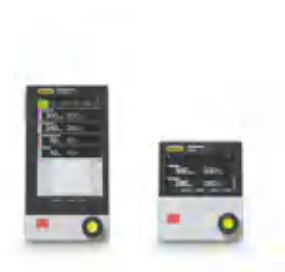
Интерфейс I-300 / I-300 Pro Централизованное управление всеми параметрами процесса