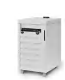
Циркуляционный охладитель F-305 / F-308 / F-314 Эффективный способ охлаждения, экономящий воду