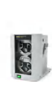
Вакуумный насос V-300 Бесшумный и экономичный источник вакуума